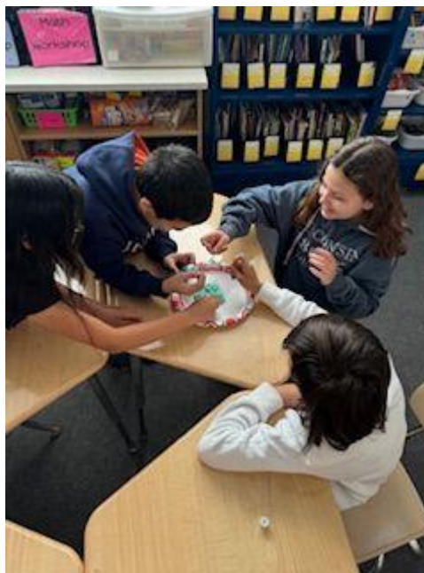
Pasta do zębów słów - Lekcja SEL z klasą 5 Działalność na rzecz budowania społeczności w całej szkole