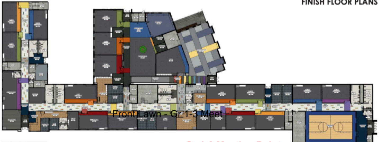
FINISH FLOOR PLANS