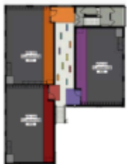
LOWER FLOOR PLAN