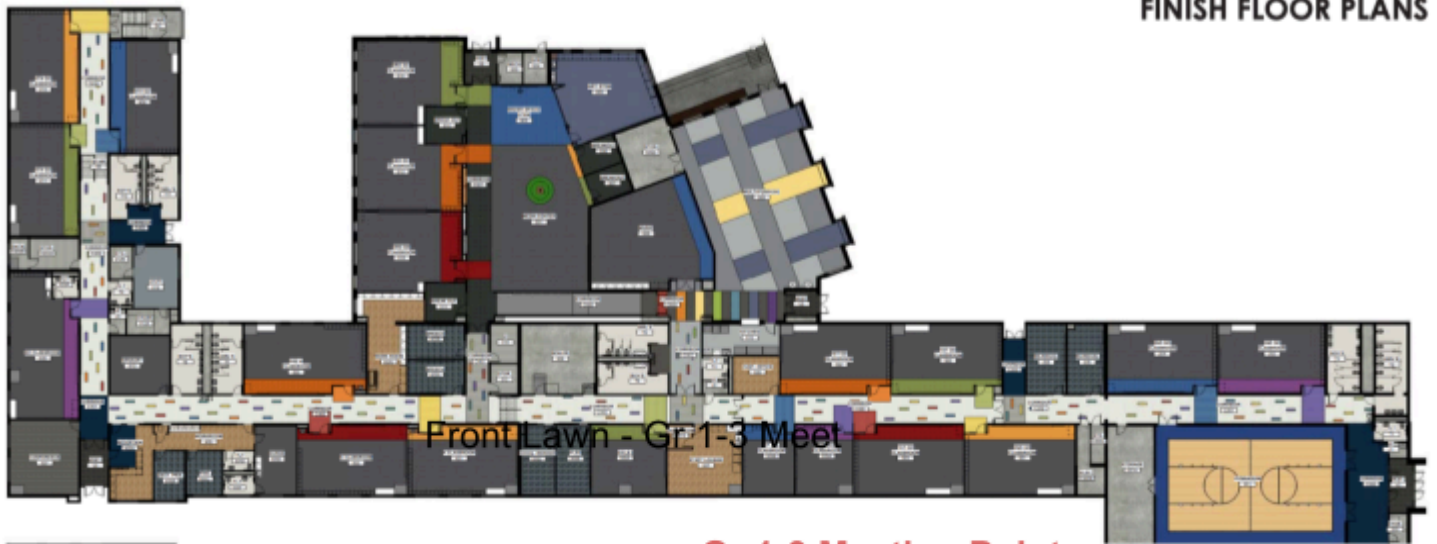
FINISH FLOOR PLANS