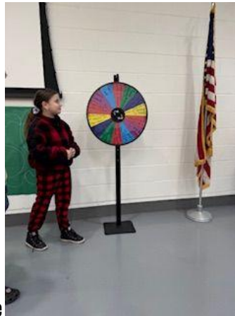
Poniedziałkowe poranne spotkanie